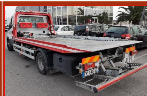
IVECO 7 T FP-145-GC