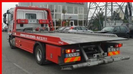
IVECO PLATEAU 12 T DL - 414 - AY