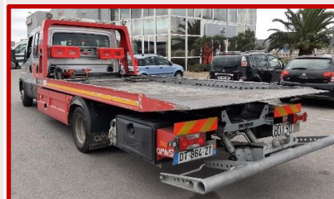
IVECO DOUBLE CABINE DT-864-ZT