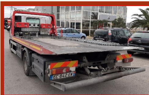
IVECO 7 T EV-542-ST