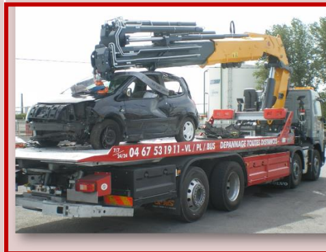
VOLVO GRUE CL-493-QD