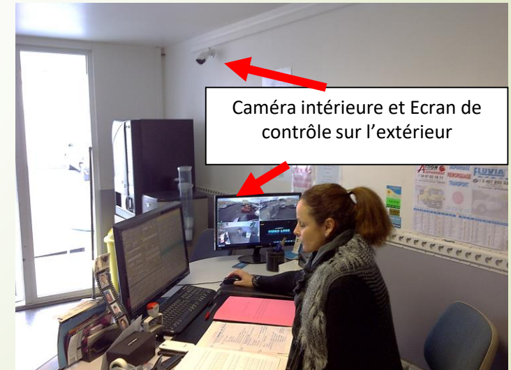
Caméra intérieure et Ecran de contrôle sur l'extérieur