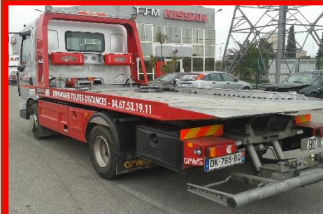
RENAULT MIDLUM DK-768-BQ