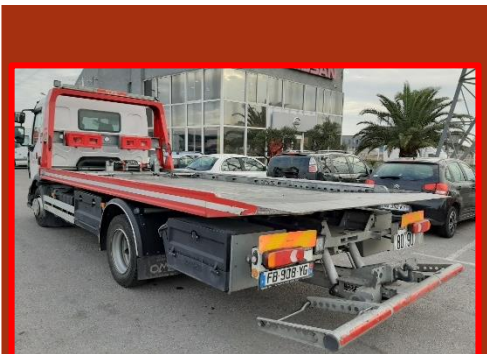
RENAULT D FB-908-YG