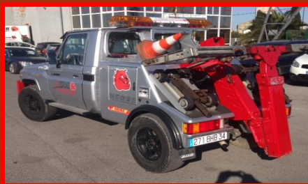
TOYOTA 4*4 271 BHB 34