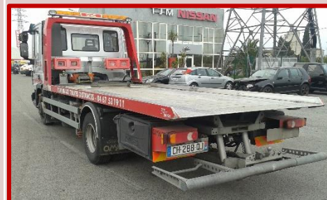
IVECO 7.5 T CH-288-QJ