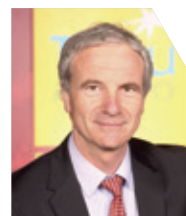
Pierre Bouldoire 3 e Vice-président Aménagement de l'espace communautaire. Maire de Frontignan