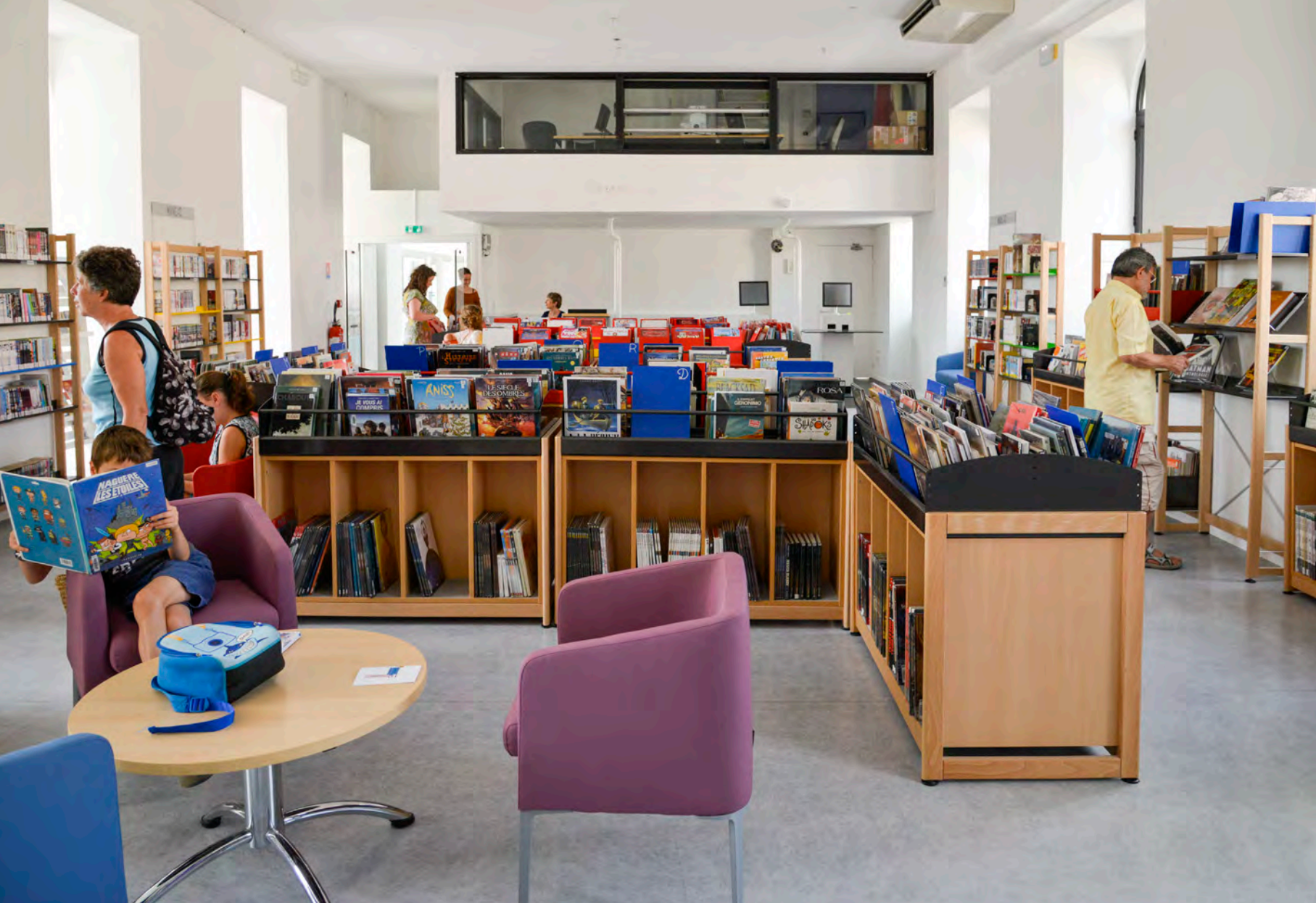
Des espaces publics réaménagés à la médiathèque Mitterrand