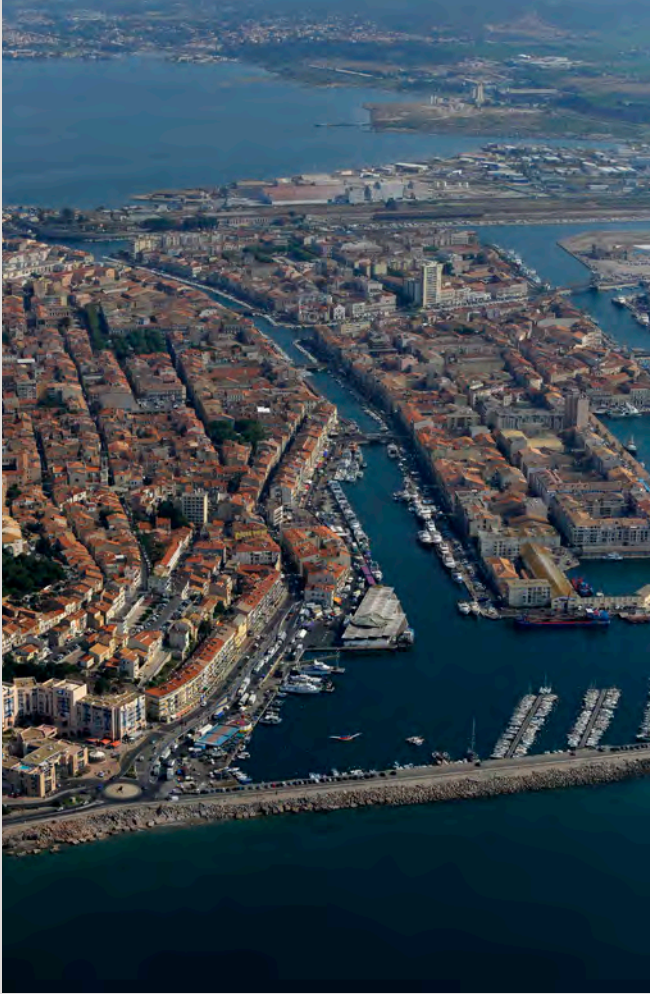
île sud à Sète