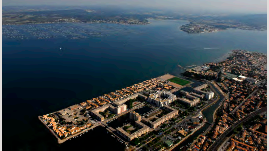
île de Thau à Sète

nels, représentants de l'État, nombreux organismes et professionnels œuvrant dans les domaines de l'emploi, la santé, l'aide sociale, l'habitat, l'éducation, la prévention...) et répond aux 3 piliers précisés par la loi : cohésion sociale, cadre de vie et renouvellement urbain, développement économique/emploi, ainsi qu'aux axes transversaux proposés : la lutte contre les discriminations et le repli communautaire, l'égalité homme/femme, la question de la jeunesse touchée par le décrochage scolaire, le chômage, la délinquance et les conduites à risques.