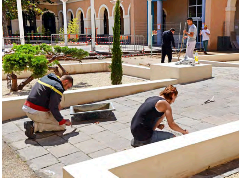
Un patio refait à Mitterrand