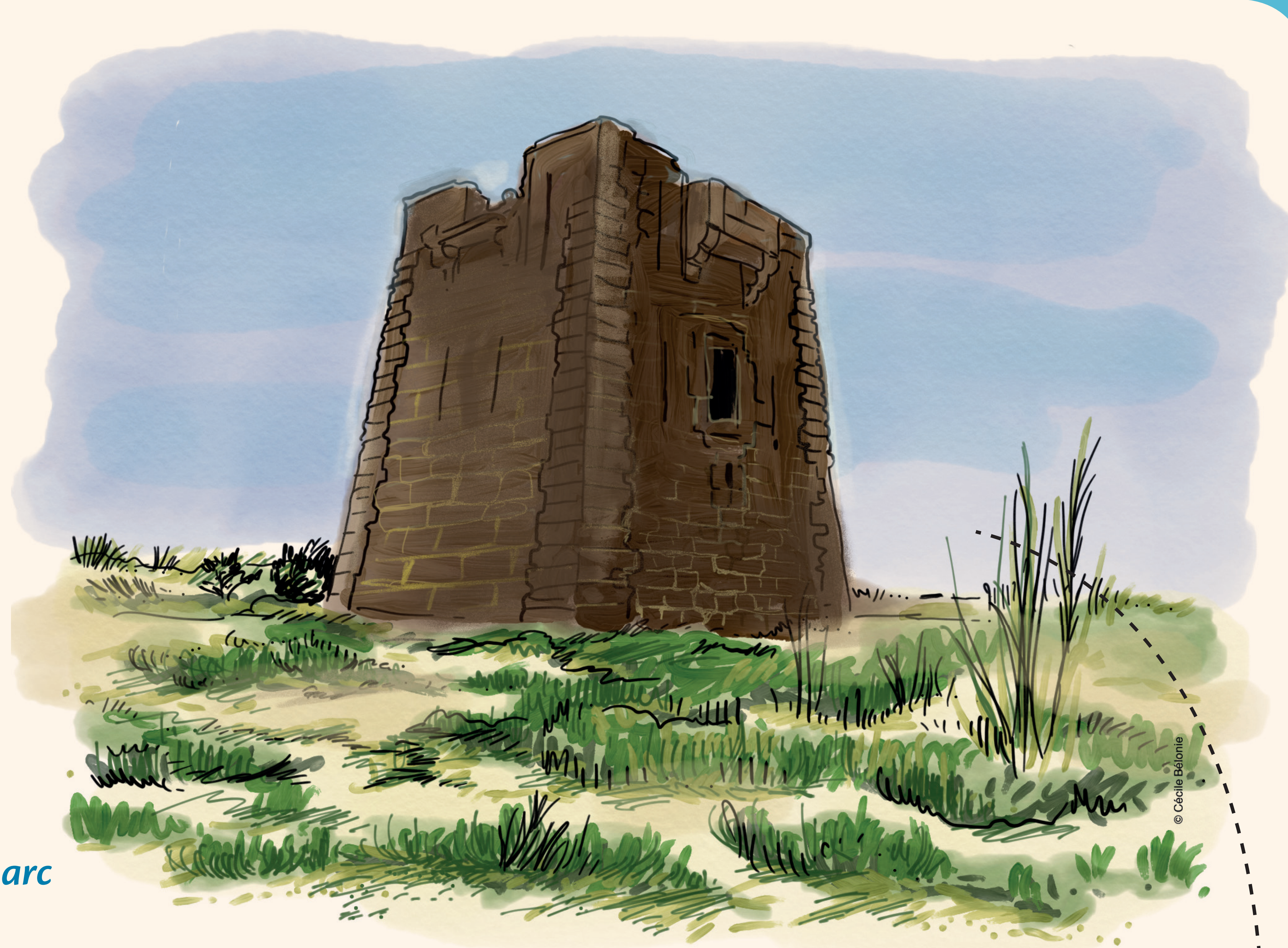
L'aménagement du lido a permis de mettre en valeur la Redoute

Une vingtaine de ces tours à signaux ont été édifiées sur la côte à la même époque pour fonctionner en réseau. Ces fortins isolés comptent deux étages avec terrasse et tourelle à feu. Au rez-de-chaussée, c'était le magasin de vivres, au premier niveau, l'unique pièce d'habitation en même temps qu'un poste d'observation. La terrasse accueillait la lanterne à feu et un poste de défense. Le jour, l'alarme était donnée par un système codé de drapeaux, précurseurs des sémaphores. Sa jumelle qui se trouvait aux Aresquiers – et dont il reste quelques vestiges - a été détruite par les Anglais le 1 er août 1808 par le capitaine Jack Aubrey, le héros du film « Master & Commander ».