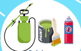
Peinture, désherbants, insecticides