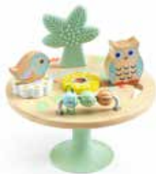
Table d'activité BabyMolti

Parée de couleurs pastel apaisantes, ce jouet d'éveil ludique en bois naturel offre quatre activités distinctes : les enfants peuvent manipuler le boulier, déplacer un hibou, faire tourner une fleur et mordiller un palmier. Djeco, à partir de 12 mois